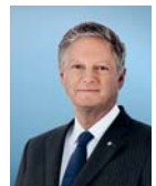
Paul Desmarais, Jr.

Der 1954 geborene kanadische Staatsbürger Paul Desmarais, Jr. ist Mitglied des Verwaltungsrates und Vorsitzender des Nomination & Compensation Committee der LafargeHolcim Ltd. Er wurde 2015 in den Verwaltungsrat der LafargeHolcim Ltd gewählt. Er verfügt über einen Bachelor in Betriebswirtschaft der McGill University, Montréal, Kanada, und einen MBA des European Institute of Business Administration (INSEAD), Paris, Frankreich. Von 2008 bis 2015 war er Mitglied des Verwaltungsrates der Lafarge S.A. und bis 2015 auch Mitglied ihres Strategy, Investment and Sustainable Development Committee. Paul Desmarais, Jr. ist Vorsitzender und Co-Chief Executive Officer der Power Corporation of Canada sowie Executive Co-Chairman der Power Financial Corporation, beide mit Sitz in Montréal, Kanada. Er kam 1981 zur Power Corporation, wo er im folgenden Jahr die Position des Vizepräsidenten übernahm. 1984 leitete er die Gründung von Power Financial, in der die grossen Finanz-Holdinggesellschaften der Power Corporation sowie die Pargesa Holding SA, Genf, Schweiz, in einer einzigen